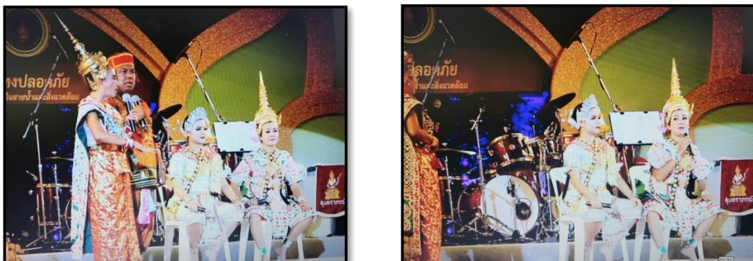
ภาพที่ 1-2 การแสดงละครชาตรี เรื่องสังข์ทอง โดยคณะละครชาตรีภัญญา ลูกแม่แพน (เมื่อวันที่ 3 พฤศจิกายน 2560 ณ วัดราชาธิวาส กรุงเทพฯ)

ผลการวิจัยวัตถุประสงค์ข้อที่ 2 พบว่า 1. ผู้ที่อาศัยในชุมชนส่วนใหญ่เป็นผู้สูงอายุที่อยู่ในชุมชนมานานบางคนก็เกิดและเติบโตในชุมชนมีการประกอบอาชีพด้านศิลปะการแสดง ทำให้เกิดความผูกพันกับชุมชนมีความภาคภูมิใจในศิลปะการแสดงที่มีอยู่ในชุมชน 2. ผู้ที่อาศัยในชุมชนมีความกังวลในเรื่องสิ่งแวดล้อมภายนอกที่ส่งผลกระทบต่อชุมชน เช่น ที่ดินบริเวณชุมชนเป็นกรรมสิทธิ์ของสำนักงานทรัพย์สินพระมหากษัตริย์ มีการต่อสัญญาเช่าที่ดินของชุมชนเป็นระยะ ๆ ในอนาคตมีโครงการก่อสร้างรถไฟฟ้าใต้ดินสายสีส้ม (สถานีหลานหลวง) 3. ประเด็นเรื่องการขยายตัวหรือการอพยพของครอบครัวผู้ที่อาศัยในชุมชน สาเหตุจากพื้นที่ในชุมชนไม่สามารถขยายได้ ส่งผลให้ครอบครัวแต่ละครอบครัวเกิดภาวะครอบครัวขยายออกนอกชุมชน 4. ประเด็นความสามัคคีความร่วมมือของผู้ที่อาศัยในชุมชนที่สะท้อนออกมาในการให้ความร่วมมือของผู้ที่อาศัยในชุมชนเมื่อมีการจัดงานประเพณีสำคัญ ๆ ของชุมชน เช่น ประเพณีสงกรานต์ ประเพณีเข้าพรรษา ประเพณีลอยกระทง ฯลฯ เนื่องจากผู้ที่อาศัยในชุมชนมีความสนิทสนมคุ้นเคยกันรู้จักกันมานานมีความผูกพันส่วนใหญ่เป็นเครือญาติที่รู้จักกันภายในชุมชน 5. ส่วนปัญหาที่พบในประเด็นของบทบาทของชุมชนกับการอนุรักษ์และการสืบทอดละครชาตรีในตรอกละครนั้นพบว่า ภายในชุมชนยังไม่มีผู้ประสานงานหลักในประเด็นการอนุรักษ์และการสืบทอดสืบทอดละครชาตรี มีผู้นำชุมชนและคณะกรรมการชุมชนที่คอยดูแลภายในชุมชน ซึ่งผู้นำชุมชน คณะกรรมการบริหารชุมชน ก็ยังไม่มียุทธศาสตร์ที่เป็นรูปธรรมในเรื่องของการอนุรักษ์และการสืบทอดละครชาตรีในตรอกละคร สามารถสรุปเป็นแผนภาพได้ดังนี้